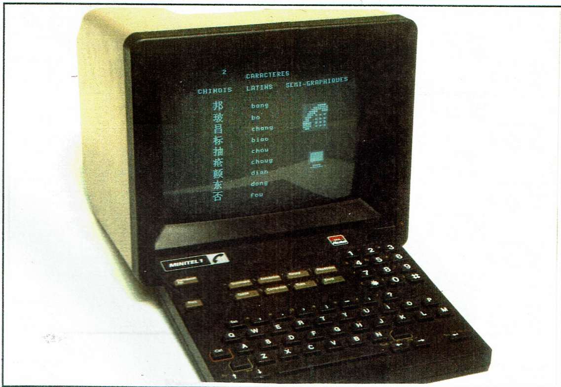
Le Minitel chinois

CE DOCUMENT NE PEUT ÊTRE COMMUNIQUÉ À DES PERSONNES EXTÉRIEURES À FRANCE TELECOM ET À TDF SANS L'AUTORISATION ÉCRITE DU DIRECTEUR DU CCETT. SA REPRODUCTION EST INTERDITE.